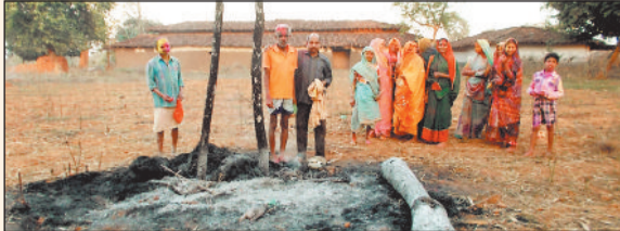
हरिभूमि न्यूज ►► जशपुरनगर