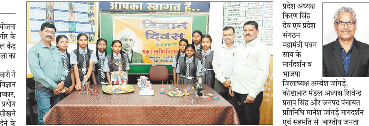
जानकारी प्रदान करते शिक्षक।

विज्ञान दिवस के अवसर पर जिला परियोजना समन्वयक राजीव गांधी शिक्षा मिशन जांजगीर के आदेशानुसार बलोदा ब्लॉक के अंतर्गत संकुल केंद्र सिवनी मुख्यालय में संकुल स्तरीय विज्ञान मेला का आयोजन किया।