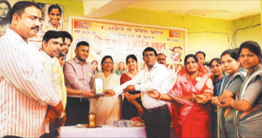
कार्यक्रम में उपस्थित अतिथि एवं अन्य।

नगर पंचायत नरियरा स्थित दिव्य शक्ति मॉडर्न स्कूल परिसर में वेल विशर फाउंडेशन द्वारा निःशुल्क स्वास्थ्य शिविर एवं जागरूकता कार्यक्रम का सफल आयोजन किया गया जिसमें छात्र-छात्राओं के साथ