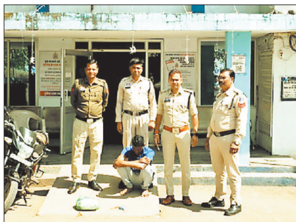
हिरासत में लेकर पूछताछ की गई। शुरु में आरोपी पुलिस को गुमराह