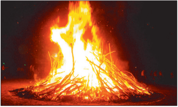
बुराई के प्रतीक पर्व होलिका का हुआ दहन।

होलिका दहन किया गया। ऐसी मान्यता है कि इस पर्व पर बुरे विचारों के शमन के प्रतीक के रूप में होलिका दहन की जाती है। महिलाओं ने होलिका दहन के पूर्व हिन्दू मान्यता के अनुसार विधि विधान से पूजा -पाठ किया एवं लकड़ी एवं कंडे का अर्पण किया। 4