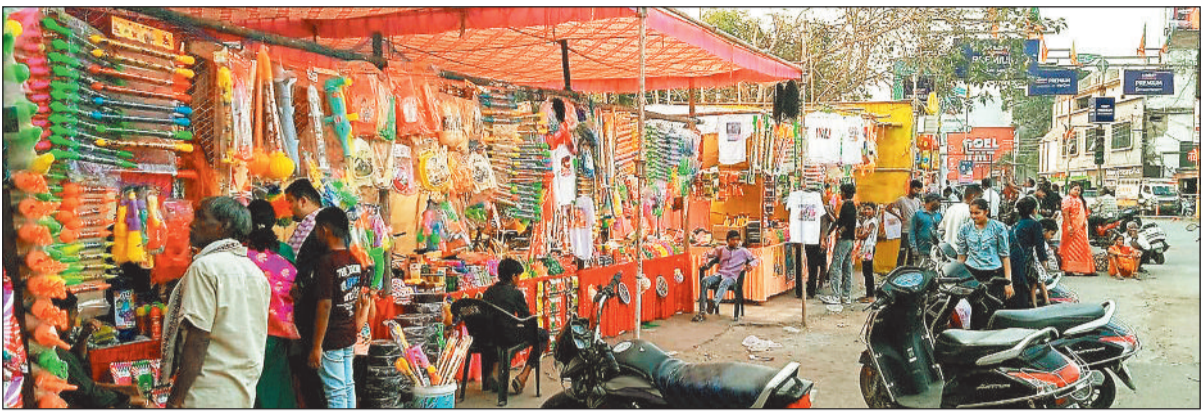
बुराई के प्रतीक पर्व होलिका का हुआ दहन।

फाल्गुन माह के शुक्ल पक्ष की पूर्णिमा को रंगों का पर्व होली मनाया जाता है। हिन्दू काल ज्योतिष गणना के मुताबिक यह वर्ष का अंतिम दिवस होता है। इसके पूर्व रात्रि में जगह-जगह लोगों ने होलिका दहन किया। हालांकि इस बार कई जगहों पर सोमवार की रात्रि में होलिका दहन किया गया। वहीं कुछ स्थानों पर मंगलवार को होलिका दहन किया गया। मंगलवार को होलिका दहन के लिए लोगों को शुभ मुहूर्त के लिए थोड़ा इंतजार करना पड़ा। मंगलवार को चंद्रग्रहण एवं भद्रा लगने की वजह से कुछ लोगों ने भद्रा के पुछ में 7 बजकर 9 मिनट में होलिका दहन किया वहीं कुछ ने रात्रि 1 बजकर 26 मिनट से 2 बजकर 36 मिनट के बीच में