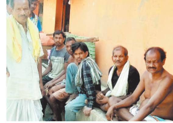
गांव की गली में बैठे ग्रामीण और गांव में कौतून करते लोग।